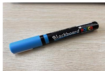
ブラックボードマーカーを使用