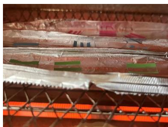
オーブントースターで加熱