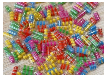
いろんな色のビーズができました!!