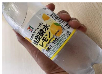
炭酸飲料のボトルがオススメ

創作活動をしていく中で、廃品をうまく活用してモノづくりを楽しめるものを探しております。 スタッフ間で、「こんなのも出来ますよ〜」と教えてもらったのが、ペットボトルを使ったビーズ。 ペットボトルをカッターで切り取り、着色して、オーブントースターで加熱したら、くるっと丸まって 筒状のビーズになりました。ペットボトルは炭酸飲料に使われているものがきれいに仕上がります。 利用者さんと沢山ビーズを作って、それをさらに材料として、新たな作品を創ってあげたらと今から ワクワクしております。(^^)v 作り方は下図をご参考ください。