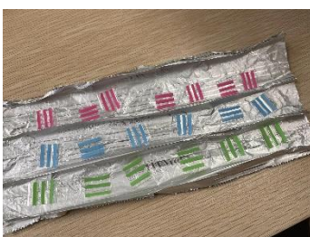
アルミホイルに乗せて…