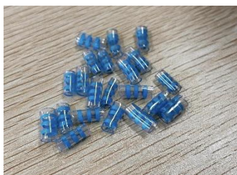
カールしたら取り出して冷ます