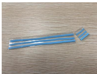
短冊を 20mm 幅に cut