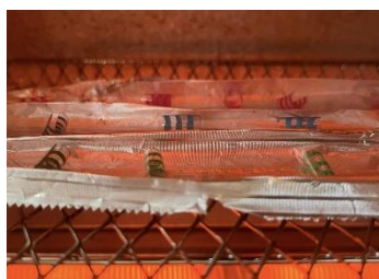
熱が加わると丸くカール