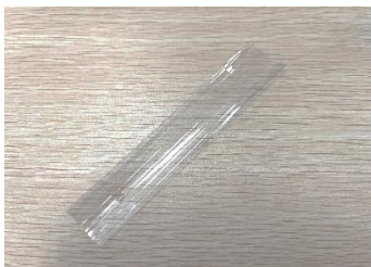
幅約 25mm の短冊状に cut